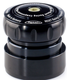
#1114-1 | KLEIN MC2/MC3