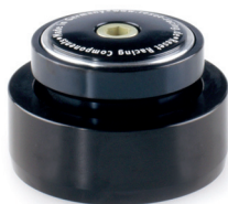
#1114-2 | KLEIN MC3.1